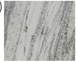
A161 Ripple Gray