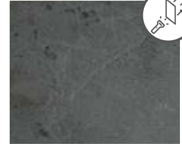
A159 K. Black