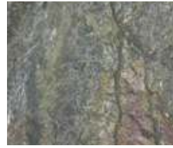
A164 Burning Forest