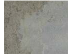
A165 Autumn Cream