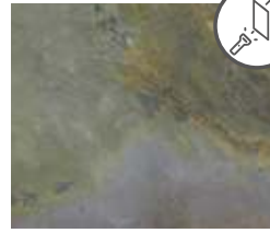
A160 I. Autumn