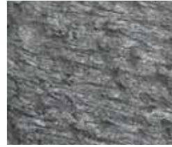
A158 Evora Gray