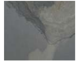
A163 Autumn Rustic